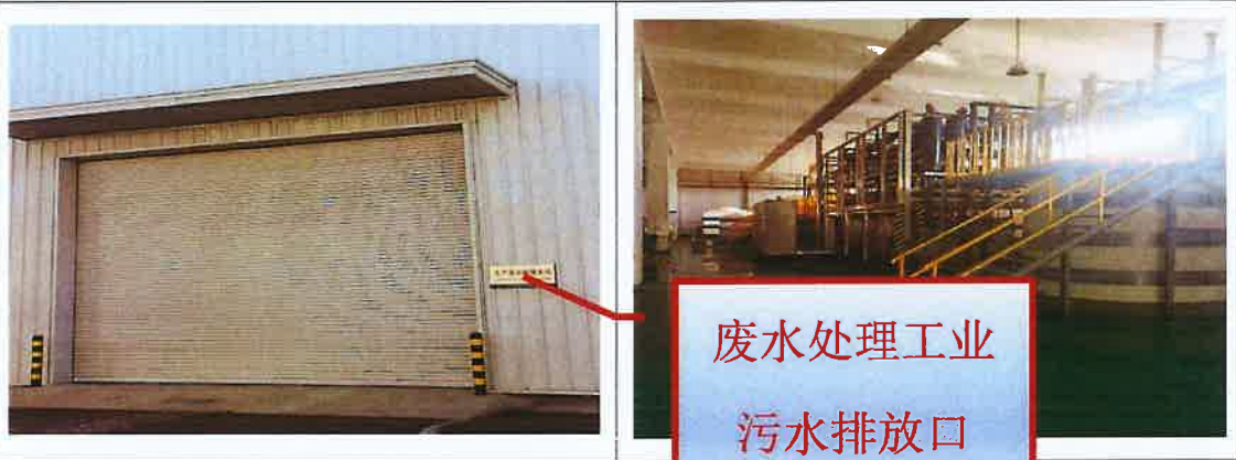
废水处理工业 污水排放口