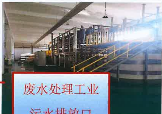
废水处理工业污水排放口