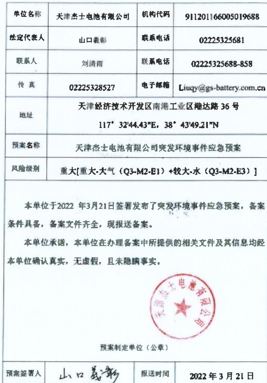
企业事业单位突发环境事件应急预案备案表