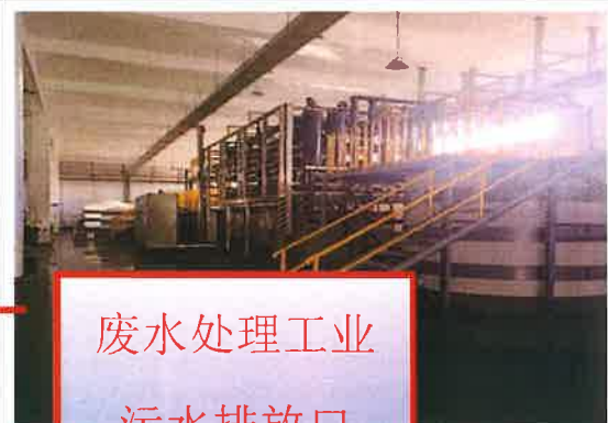
废水处理工业 污水排放口